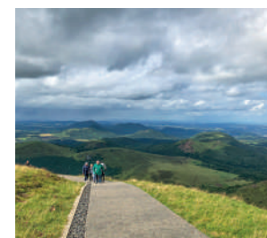
Panoramique des Dômes