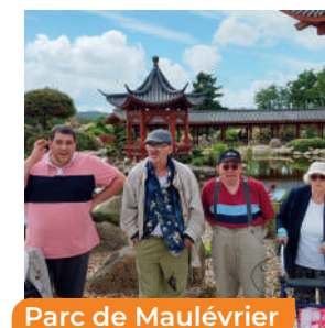
Parc de Maulévrier