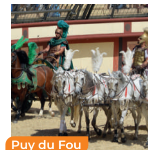
Puy du Fou